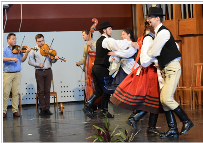
Az Ördögtérge az Kodály Zoltán Ének-Zene Iskolában. (További fotók »)