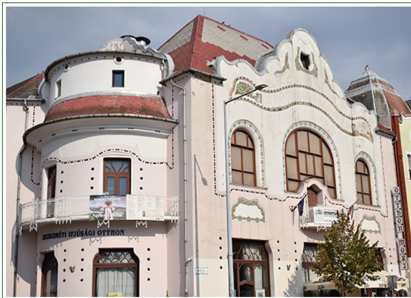
További fotók »

A két és fél napig tartó színes és sokrétű program nemcsak a kecskemétieknek, hanem a Kecskemét kistérség településeinek is nyújtott tartalmas szórakozási lehetőséget. Pénteken, 15-én de. a fellépők rendhagyó órákat tartottak különféle kecskeméti és környékbeli iskolákban és óvodákban, bemutatva egy-egy régió zenéjét, népviseletét, illetve táncait, esetenként bevonva a közönséget, diákokat, tanárokat is az éneklésbe.