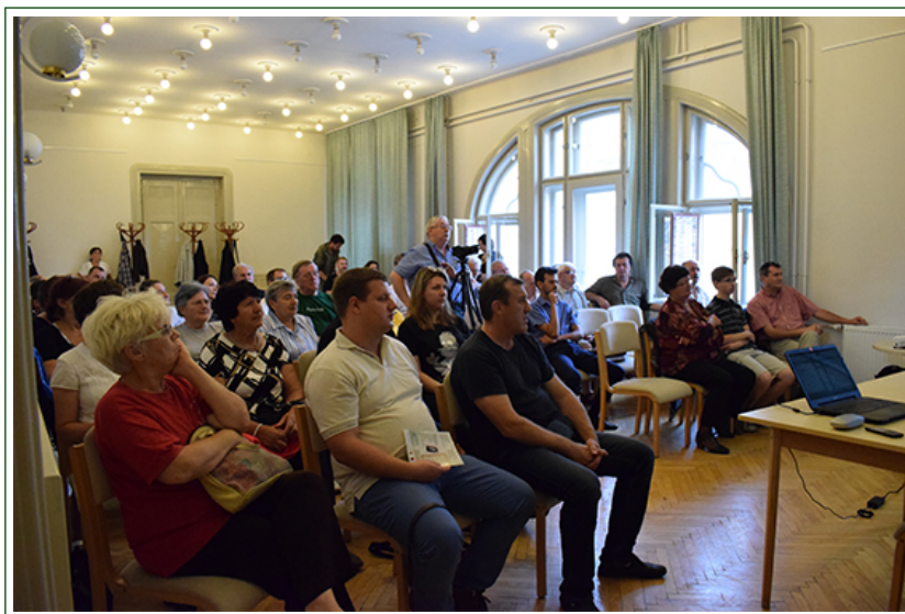
További fotók »